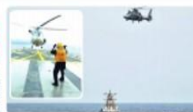
ENSENADA. Los operativos mejoran de manera significativa los niveles de adiestramiento de los marinos mexicanos