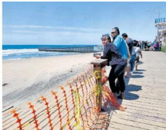
El panorama del virus en la entidad es con tendencia al alza

EL NÚMERO de casos activos y la estadística de 17.7 de incidencia por 100 mil habitantes en Mexicali, mantienen al estado en amarillo