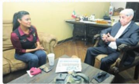
TIJUANA. Señaló la necesidad de que la autoridad represente y sea un puente entre los clases empresariales y trabajadores.