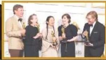
Nomadland ganó Mejor Película.

"Nomadland" se llevó la estatuilla como mejor película, directora y actriz protagonista; Anthony Hopkins, fue el Mejor actor con su interpretación en "The Father".