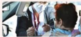
TIJUANA. Será a partir de este martes cuando se les entregue la vacuna Covid-19 a los docentes.